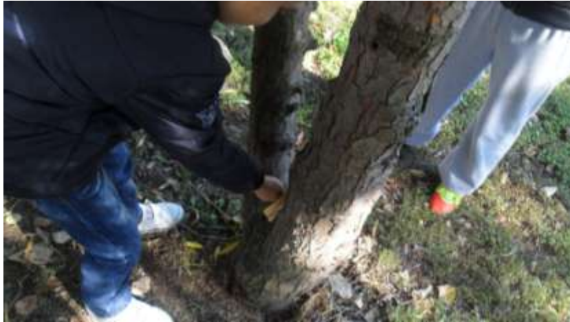
Slika 25. Mrvice kruha i kukuruz za ptice stolarice