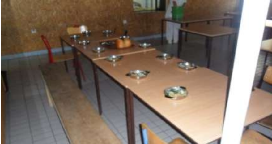
Slika 11. Školska blagovaonica