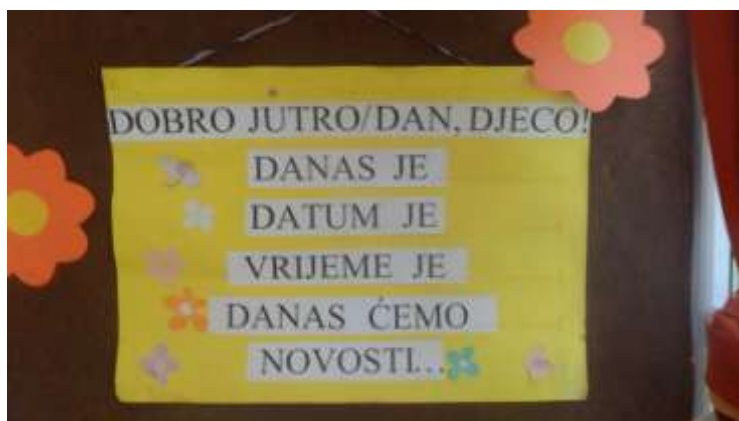
Slika 4. Plakat

Aktivnost nastavljamo najavom učiteljice koja ukratko prepriča sve aktivnosti koje nas očekuju tijekom dana. U sjedeći u krugu na tepihu podijelimo novosti od prethodnog dana, taj dio je učenicima izrazito zanimljiv.