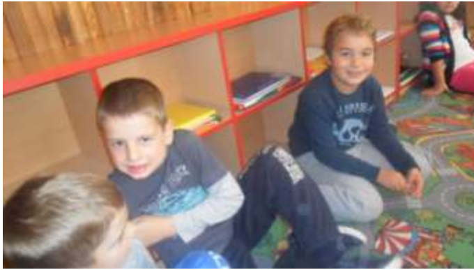
Slike 28., 29. i 30. Igramo se!