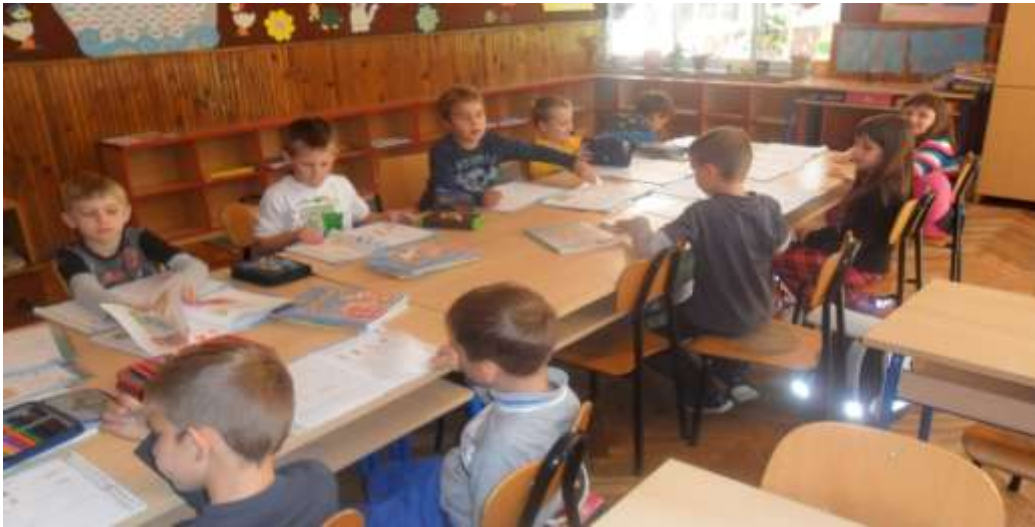
Slika 31. Pisanje domaće zadaće