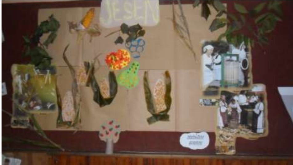
Slika 23. Pano