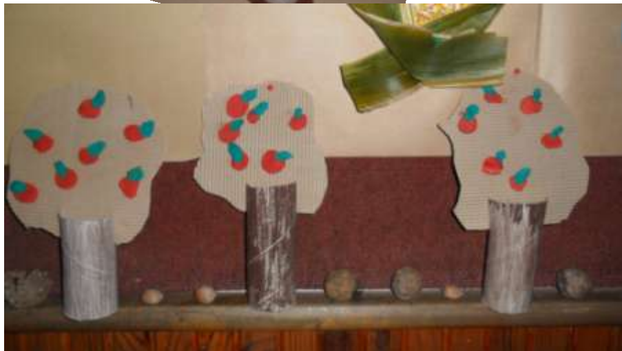
Slika 19.i 20. Voćnjak u jesen – šljive i jabuke