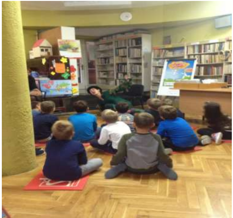
Slika 24. Posjet školskoj knjižnici

Svi učenici aktivno su sudjelovali u pripovijedanju bajke, a u svoje učionice otišli su puni dojmova.