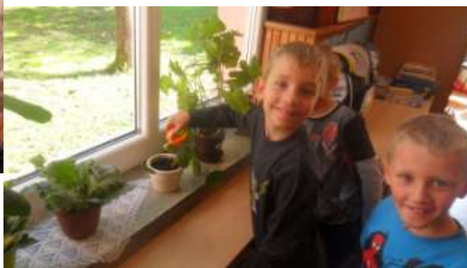
Upoznajmo školske prostorije i okoliš