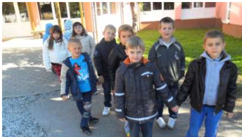
Ususret jeseni (osjećam, čujem, vidim jesen, šetnje, igre u parku).