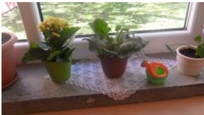
Slika 6.,7., 8. i 9. Briga za školsko cvijeće