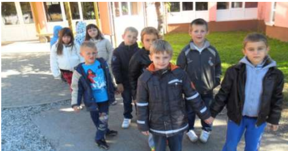
Slika 12. Upoznavanje vanjskog prostora škole