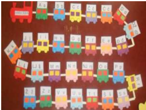
Slika 32. Abeceda

Vrijedno, svakodnevno, pišemo domaću zadaću!