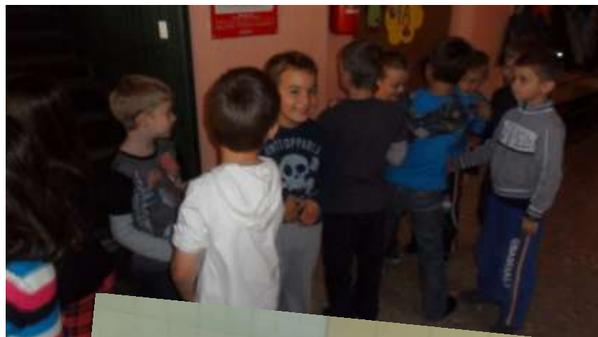
Slika 10. Upoznavanje prostora škole, hodaње u koloni, hodaње po hodnicima, odlazak na užinu i ručak