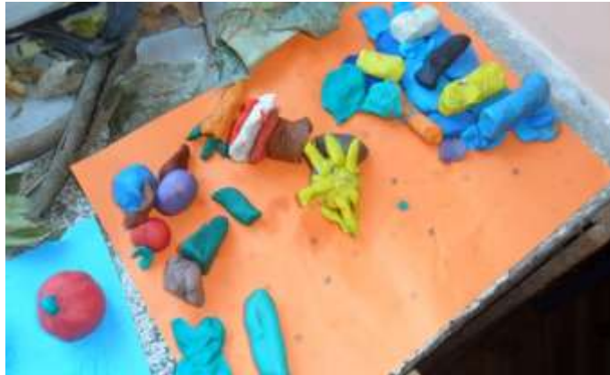
Slika 18. Modeliranje u plastelinu