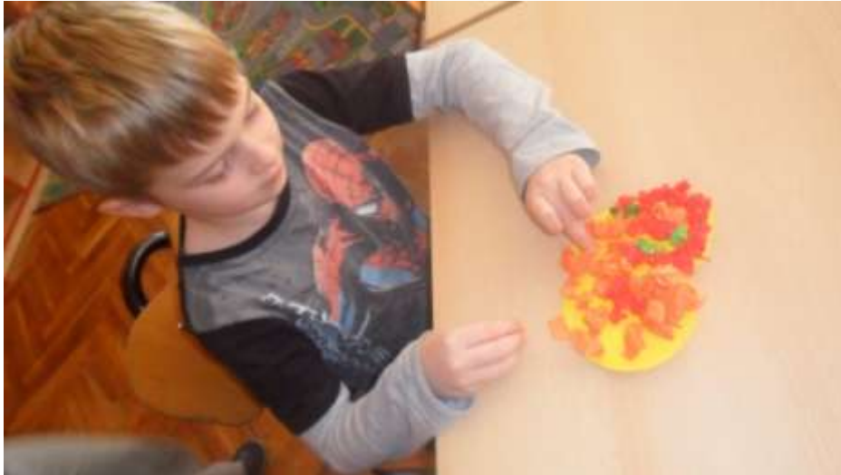
Slika 15. Jabuka