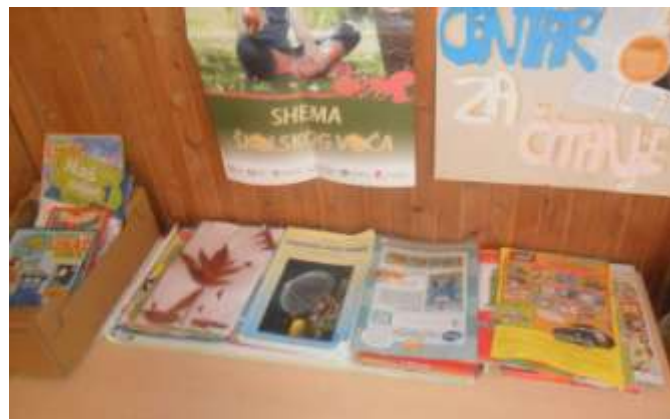
Slika 1.i 2. Kutić, centar za čitanje