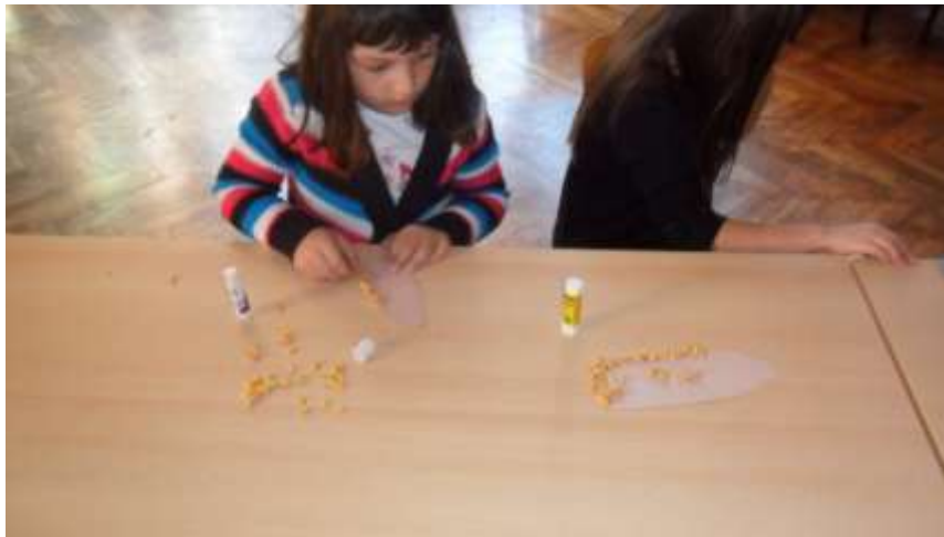
Slika 16. i 17. Izrada klipa kukuruza