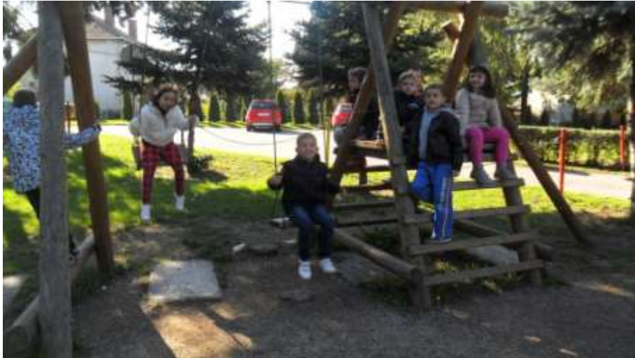
Slika 13. Upoznavanje školskog igrališta

Dočekali smo novo godišnje doba – JESEN !