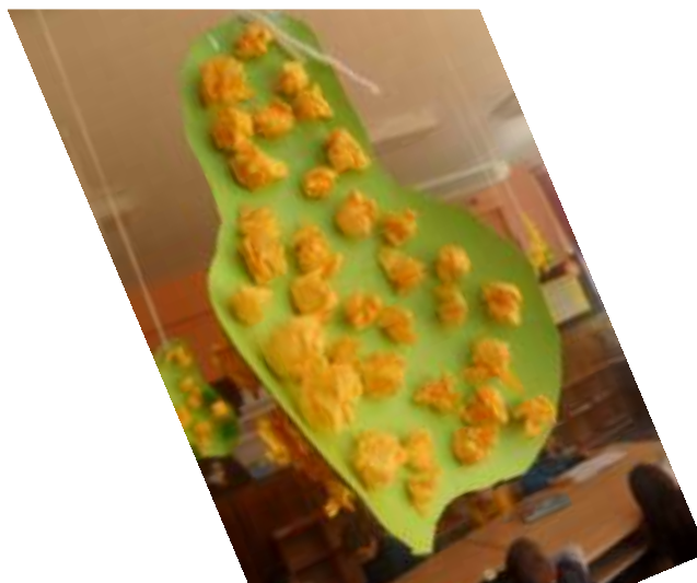
Slika 14. Mobil- kruška

Uređenje panoa i prikupljanje jesenskih plodova, izrada jesenskog kutića.