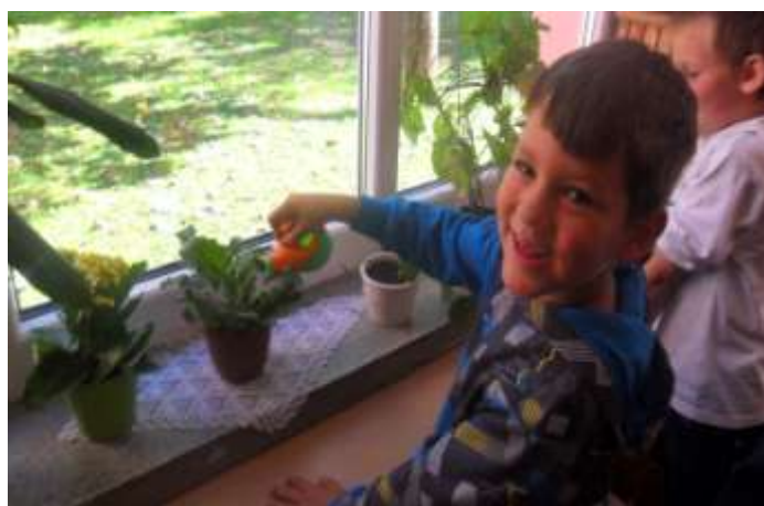
Dječaci se vole brinuti za cvijeće!