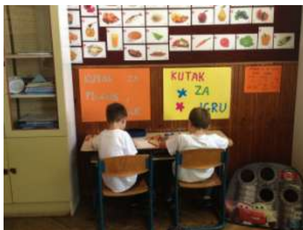
Slika 3. Kutak za igru, kutak za crtanje i pisanje

Svaki naš zajednički početak radnog dana započinjemo POZDRAVOM, zapisujemo na ploču koje je dan u tjednu, datum, te crtamo simbolima kakvo je vrijeme toga dana.